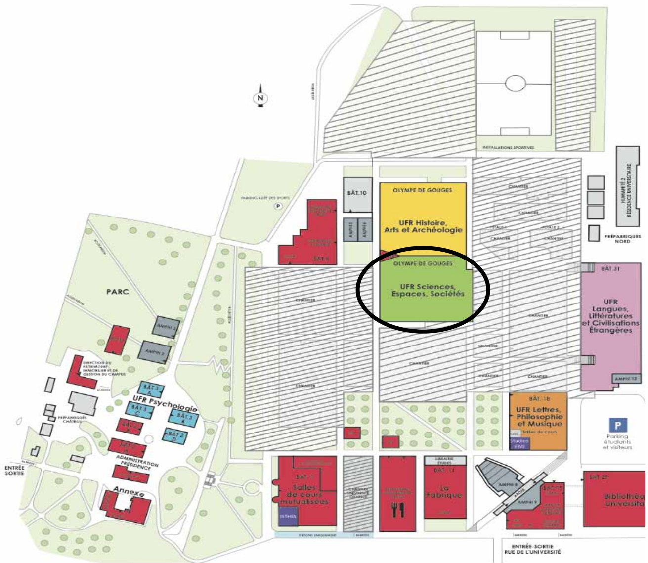
Métro ligne A (Rouge) Station Mirail Université